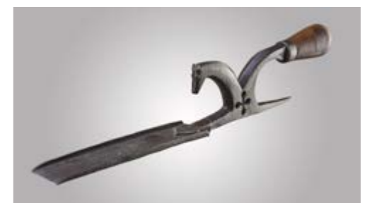
1/Salle du charron 2/Ex-voto, bannière de procession en objets de récupération, début 20° 3/Boutoir de maréchal-ferrant forgé et sculpté par l'artisan, fin 18°