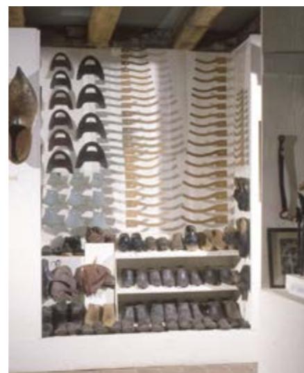
1/Panoplie d'outils du maréchal-ferrant (flammes...) 2/Ensemble de galoches, formes et gabarits

« Pour moi la création est partout, dans l'art comme dans l'artisanat car l'art et la vie quotidienne n'ont fait qu'un pendant des siècles. »